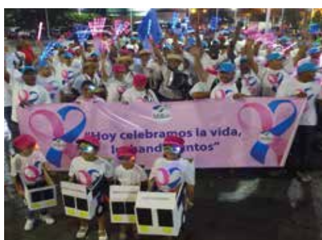
Caminata de las Luces