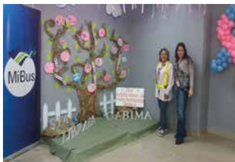
C.O.E. La Cabima - Santa Librada