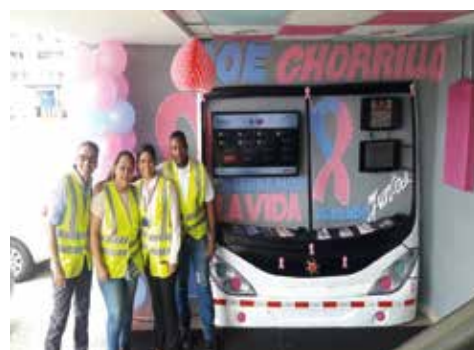
C.O.E. El Chorrillo