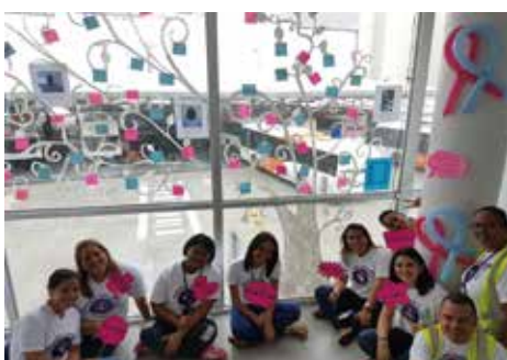
C.O.E. Ojo de Agua