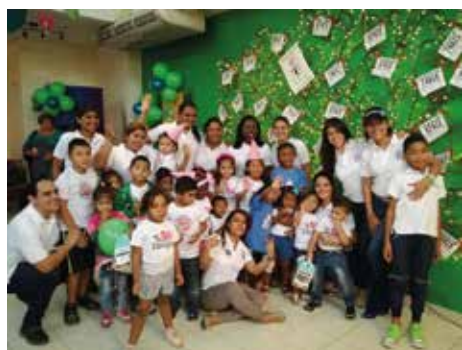
Visita a FANLYC

Además, participamos de la Caminata de las Luces del Despacho de la Primera Dama y se realizaron donaciones a FANLYC y al Instituto Oncológico Nacional.