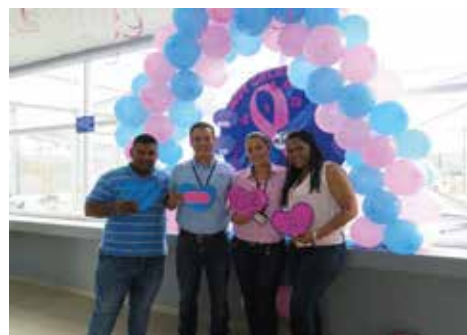
C.O.E. La Doña