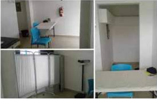
Enfermerías en todos los C.O.E.

Entre los avances del Plan de Estabilización de MiBus tenemos: