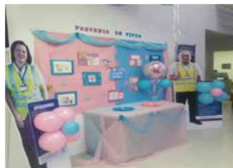
C.O.E. Los Pueblos