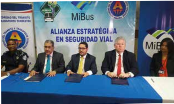
Firma de la Alianza Estratégica en Seguridad Vial para capacitar a inspectores en vía en la Terminal de Albrook

Durante el mes de la seguridad vial, unimos esfuerzos con la Autoridad de Tránsito y Transporte Terrestre, para reforzar las capacitaciones y campañas internas y externas con el fin de prevenir accidentes en la vía. "Si no es seguro, no lo hagas";