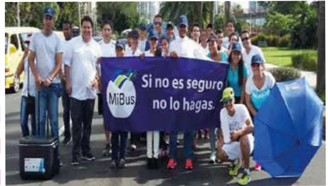
Caminata por la Seguridad Vial