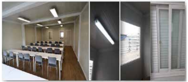
Mejoras en la zona de descanso del C.O.E. de Curundú

➡ Nuevos resaltos ( policías muertos) para la conducción segura en todos los C.O.E.