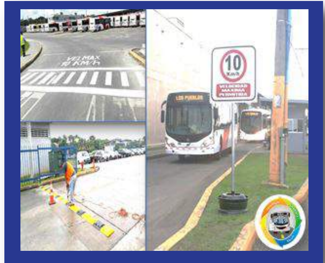
Señalizaciones y Resaltos en todos los C.O.E.