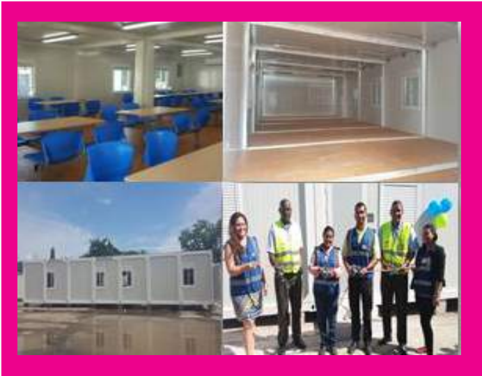
Área de Descanso en Curundú

Entre los avances del Plan de Estabilización tenemos: