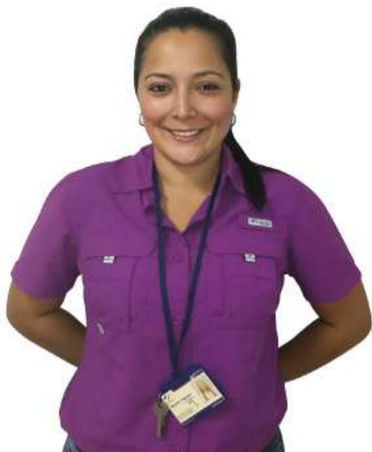
Gerente de Centro de Operación y Ejecución de Patio Curundú